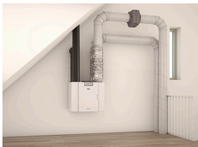
Door de Evap Air Cooler te installeren in het afvoer kanaal van het ventilatietoestel, wordt het een onderdeel van het ventilatiesysteem.

De Evap Air Cooler is een systeemmodule voor het koelen van lucht als aanvulling op het ventilatiesysteem met warmterugwinning, zoals een Flair. De Evap Air Cooler werkt op het principe van het verdampen van water, ook wel adiabatische koeling genoemd. Verdampingskoeling met water is niet nieuw. Zo worden buitenterrassen in landen met een heet klimaat vaak gekoeld met water. Dit vernevelde water verdampt vrijwel direct. Doordat voor verdamping warmte nodig is daalt de temperatuur op het terras een aantal graden. Doordat de Evap Air Cooler in het kanaal van de luchtafvoer wordt geplaatst wordt de verdampende vochtige lucht naar buiten afgevoerd en komt niet in de woning terecht.